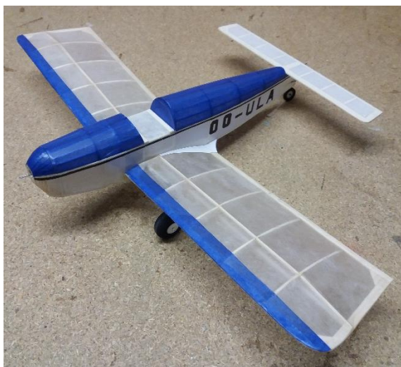
Ils construisent !

Quelques acteurs de la compétition la plus idiote de l'histoire de l'aviation !