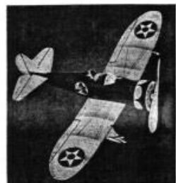
BOEING P-36-A 16" Wingspan Kit No. A-138..... 10c